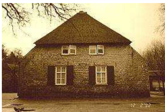
Westelbeers - ouderlijke woning

Om te kunnen voorzien in de dagelijkse behoeften, diende vanzelfsprekend elk van de 13 kinderen zijn steentje bij te dragen. Omstreeks 6:00 uur in de morgen werd de dag ingeleid en waste ieder zich buiten, met water uit een emmer. Daarna werd het vee gevoederd en omstreeks 8:00 uur werd er ontbeten met spek, brood en koffie. Aan de ontbijt tafel deelde vader de taken uit aan de kinderen die niet meer schoolgaand waren of niet elders in loondienst werkten. En met de hulp van oudste dochter Kee ontfermde moeder zich over de huishoudelijke taken.