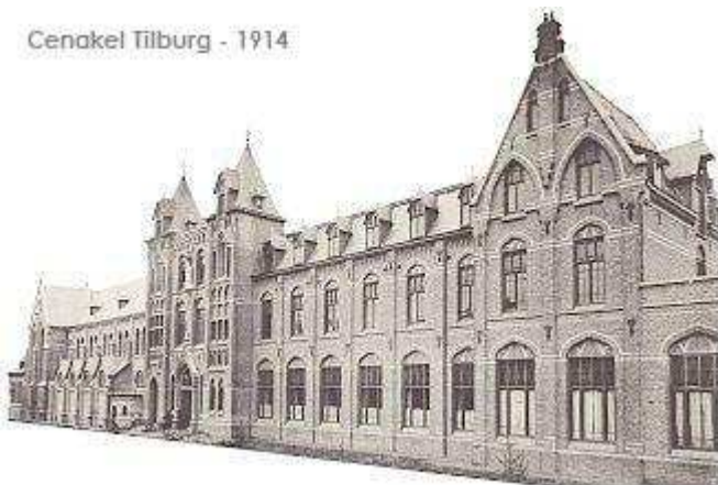
Cenakel Tilburg - 1914

Maar na wat dieper in zichzelf te graven, kan Tonia evenwel ook nog naar andere aspecten verwijzen die, al dan niet in meerdere mate, meespeelden bij haar motivatie tot intrede. Zo vond ze zichzelf destijds eerder wat mensenschuw , hield ze niet zo van veel gezelschap of drukte en vormden de stilte, geborgenheid en veiligheid van het klooster destijds een aantrekkelijk gegeven.