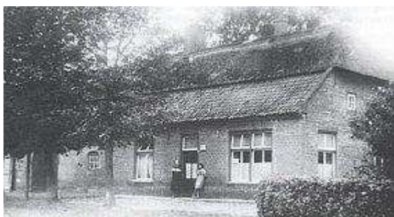
DIESSEN: café Snelders