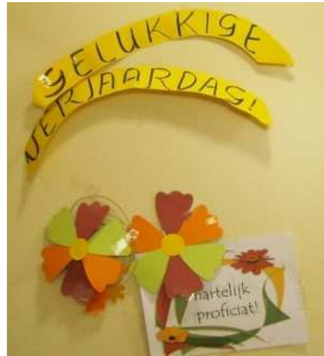
decoratie kamerdeur Tonia 104

Boven getoonde afbeeldingen maken enkel duidelijk dat er geen sprake kan zijn van enige oprechte aandacht of bezieling, zelfs niet voor een uitzonderlijke hoge leeftijd van mevr. Nouwens!