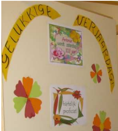
decoratie kamerdeur Tonia 103

Precies gedurende slechts één dag werden er een paar oude en eindelijk herbruikte decoraties op de kamerdeur van mevr. Nouwens bevestigd. Precies dezelfde en ondertussen onfrisse 'versieringen' als het jaar voordien in 2010, werden in 2011 zelfs ongepersonaliseerd op haar kamerdeur bevestigd.